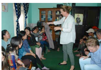
Distribution des cadeaux